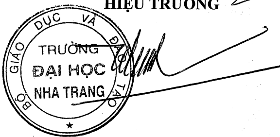
Trang Sĩ Trung

Kế hoạch được phổ biến tới các chi bộ, đơn vị và tổ chức đoàn thể trong Trường để phối hợp thực hiện đồng bộ và hiệu quả.